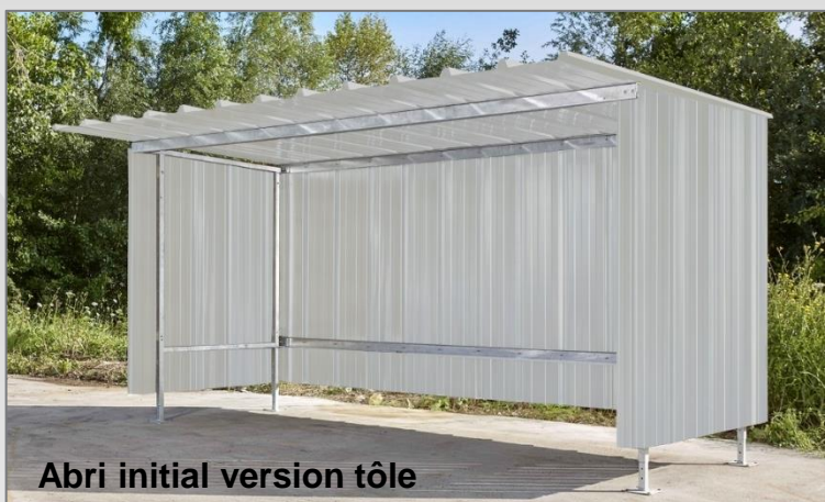
Abri initial version tôle