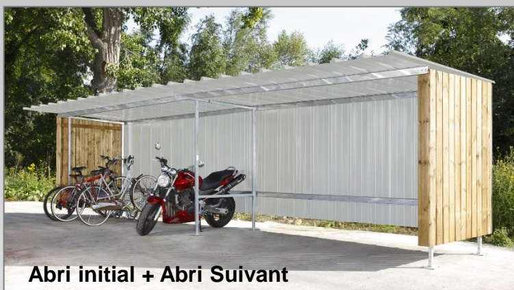
Abri initial + Abri Suivant